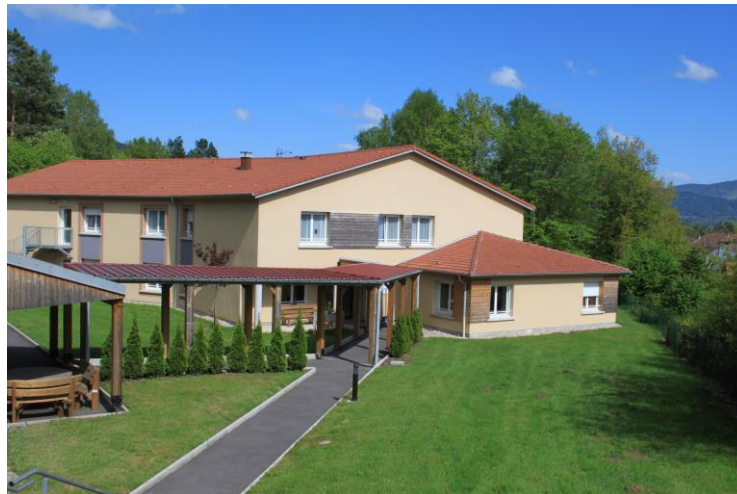
Les CHEVREUILS 19 chambres