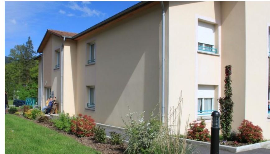
Les ECUREUILS 16 chambres 1 studio