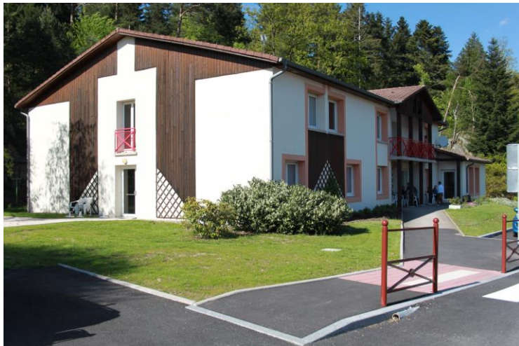
Les GEAIS 17 chambres